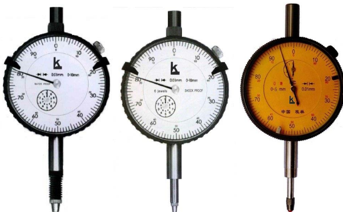
Рисунок 2 – Общий вид индикаторов модификации ИЧ