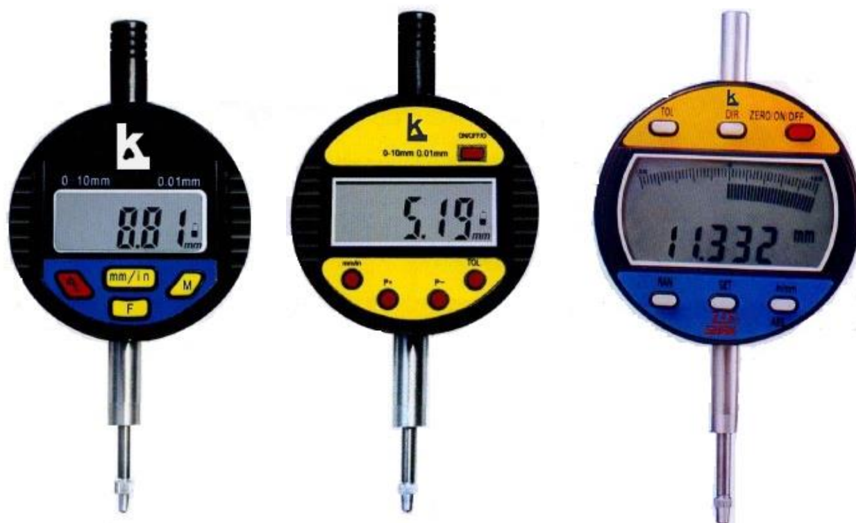
Рисунок 7 – Общий вид индикаторов модификации ИЧЦ