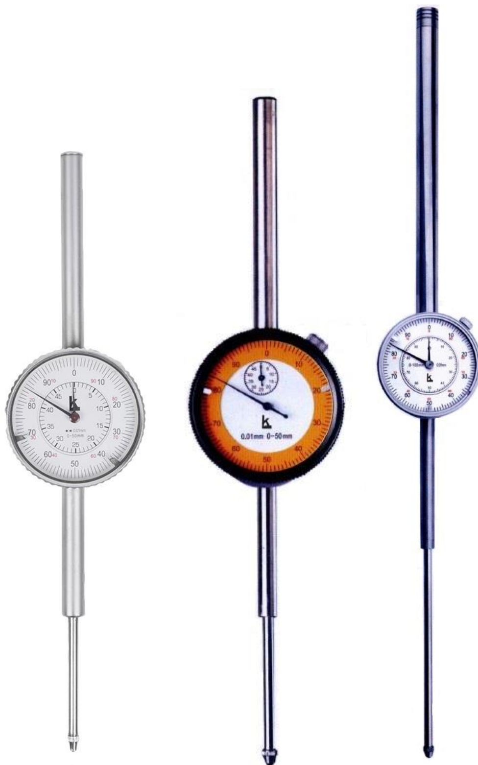
Рисунок 5 – Общий вид индикаторов модификации ИЧ