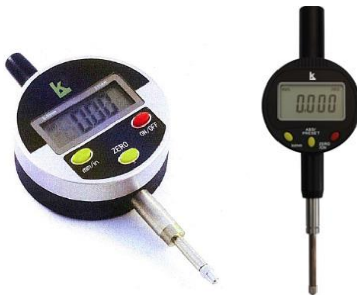
Рисунок 8 – Общий вид индикаторов модификации ИЧЦ