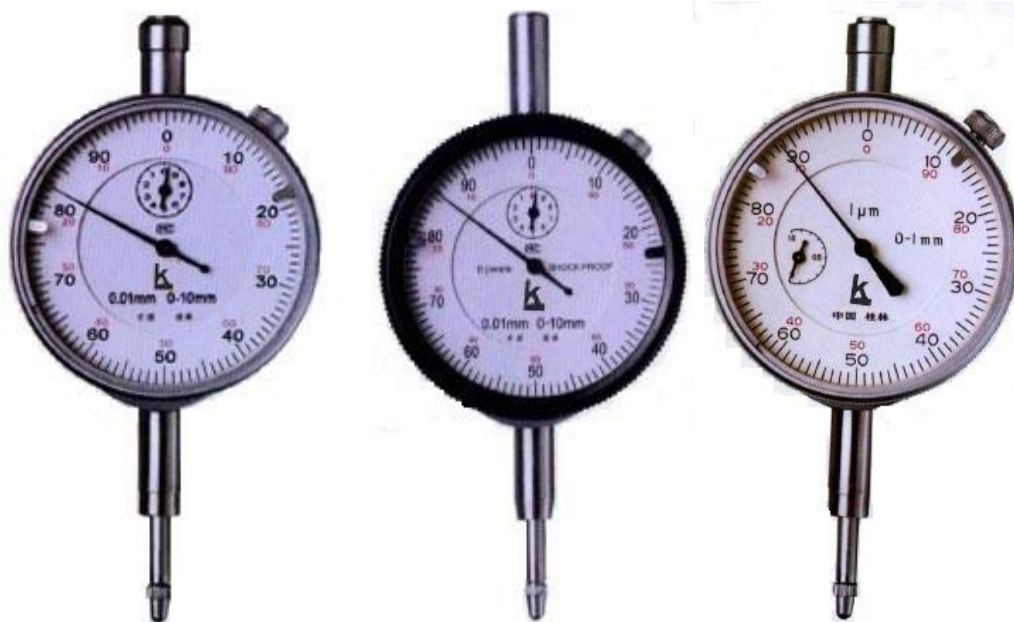
Рисунок 3 – Общий вид индикаторов модификации ИЧ