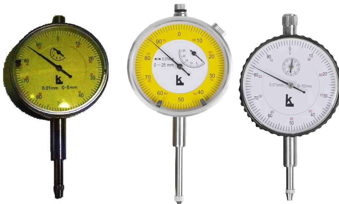
Рисунок 1 – Общий вид индикаторов модификации ИЧ

Пломбирование индикаторов от несанкционированного доступа не предусмотрено. Нанесение знака поверки на средство измерений не предусмотрено.