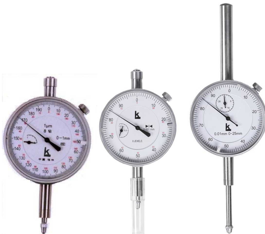
Рисунок 4 – Общий вид индикаторов модификации ИЧ