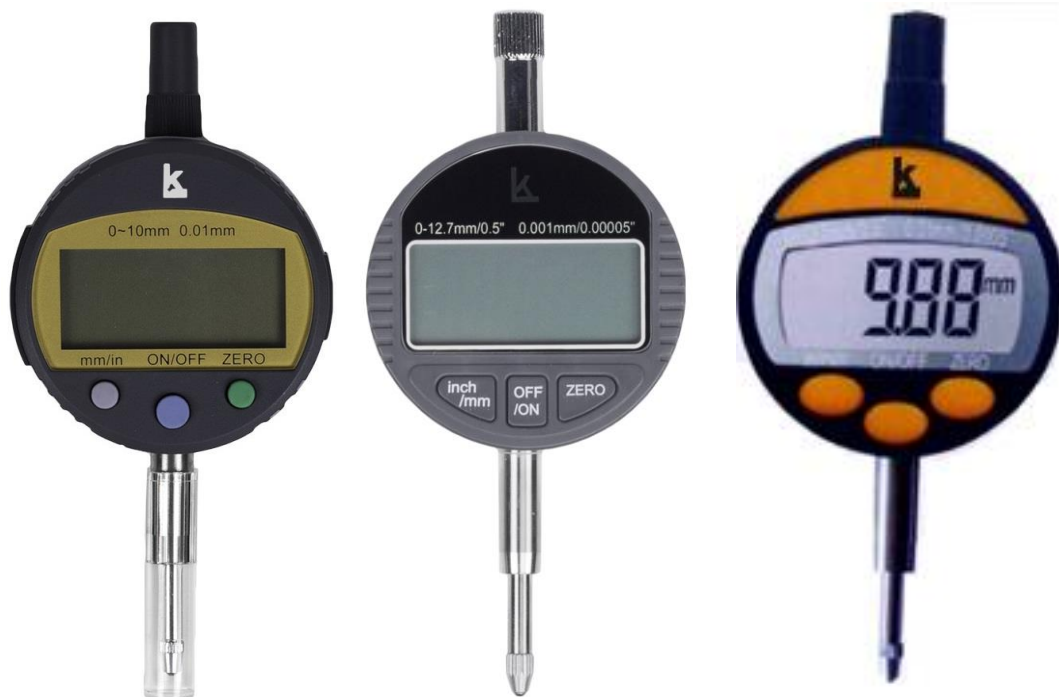
Рисунок 6 – Общий вид индикаторов модификации ИЧЦ