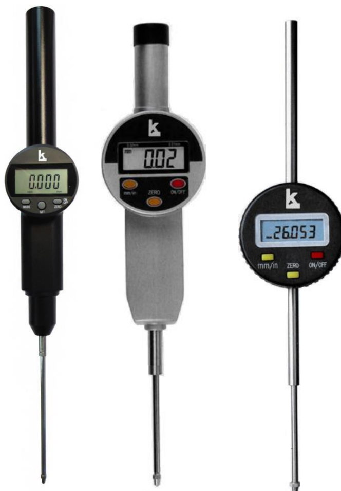
Рисунок 9 – Общий вид индикаторов модификации ИЧЦ